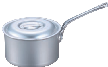
④EBM アルミ プロシェフ 深型片手鍋 (目盛付)