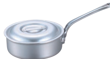
⑤EBM アルミ プロシェフ 浅型片手鍋 (目盛付)