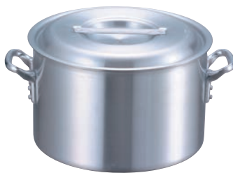
②EBM アルミ プロシェフ 半寸胴鍋 (目盛付)