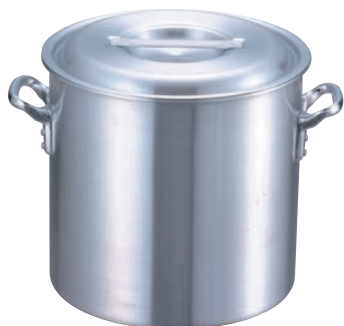
①EBM アルミ プロシェフ 寸胴鍋 (目盛付)