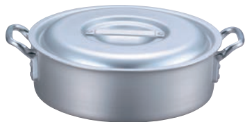
③EBM アルミ プロシェフ 外輪鍋